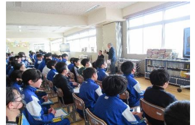
【真剣な表情の6年生】