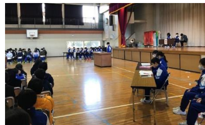
【活発に意見を出し合った児童総会】